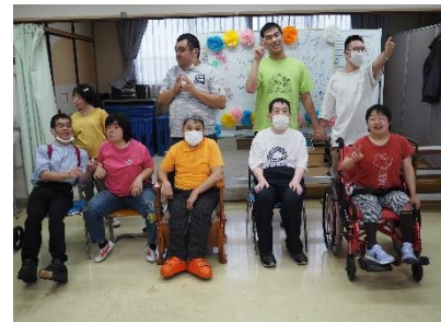
〈生活介護での記念撮影〉

また、保護者会や9月予定表でもご紹介いたしましたが、新しい出会いもありました。7月より生活介護に男性利用者様、9月より就労継続支援B型に女性利用者様のお二人が入所されています。古き良き友との思い出を胸に、新たに迎えた仲間と協力し、たんぽぽでの日常を楽しく有意義にしていきたいと考えます。