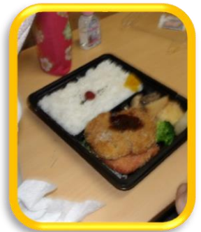
お好みのお弁当を美味しくいただきました♪