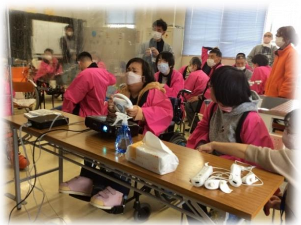
コントローラーを使ってレースに夢中!