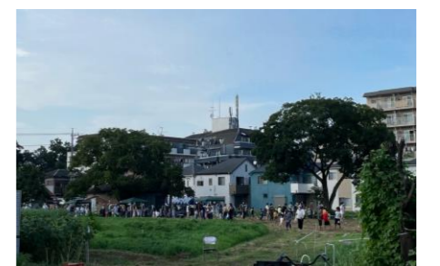
★晴天の花のある公園★