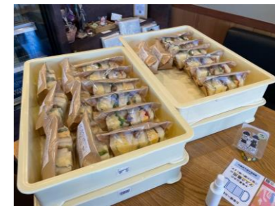
★サンドイッチ納品★