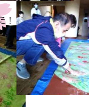
みんなで桜を咲かせました！