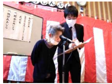
入所式 ようこそこぶしへ！