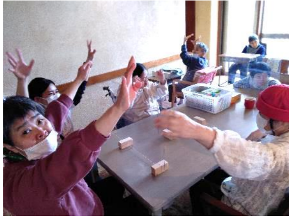
「エイ！」ストレッチャ 屋食前に、みんなで「バンザイ！」