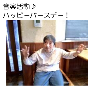
音楽活動♪ ハッピーバースデー！