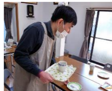
再開されたサロンでの様子

「はたらく」ことへのステップアップ。 お菓子を「食べる」が目的でなく、「作る」が目的と理解できる。