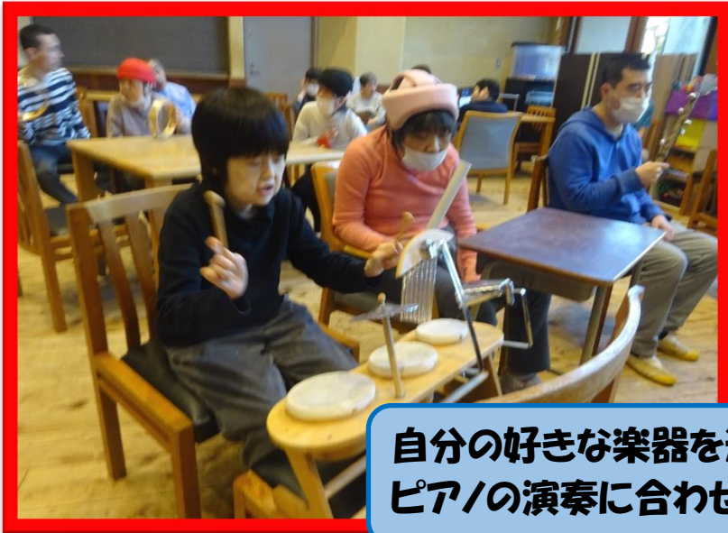
自分の好きな楽器を選択！ ピアノの演奏に合わせて、個々に演奏～♪