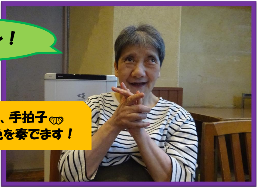
皆の演奏に合わせて、手拍子👏 手拍子も素敵な音色を奏できます！