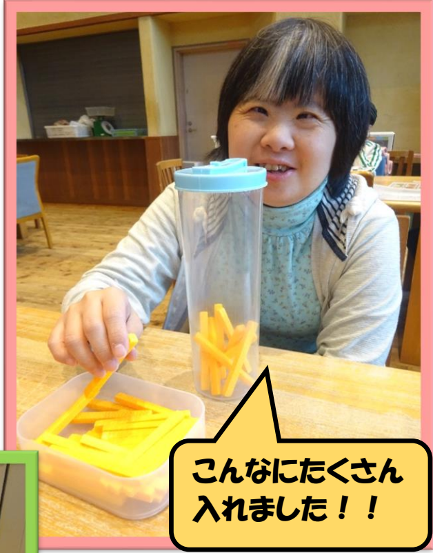
こんなにたくさん 入れました！！