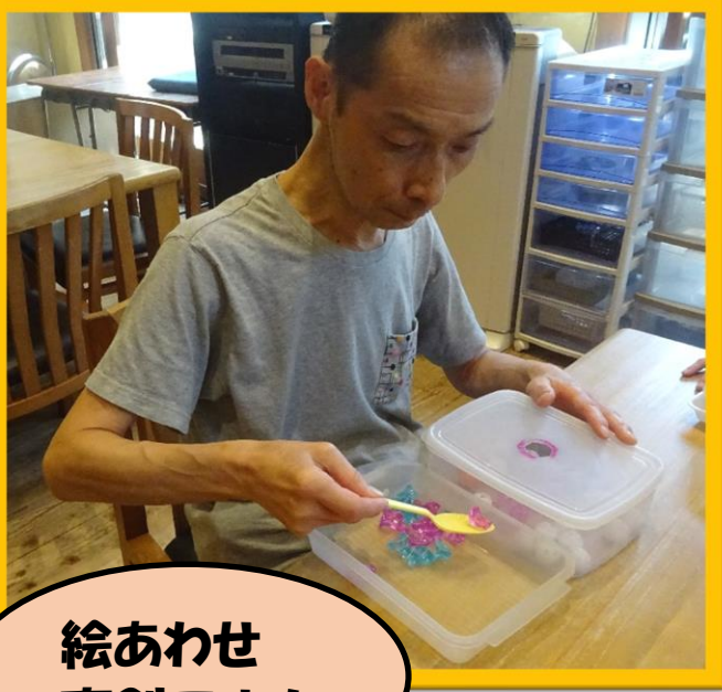
絵あわせ 真剣です！