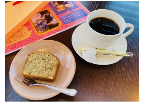
お出ししたケーキセットです。作業の様子の写真もお渡ししました。