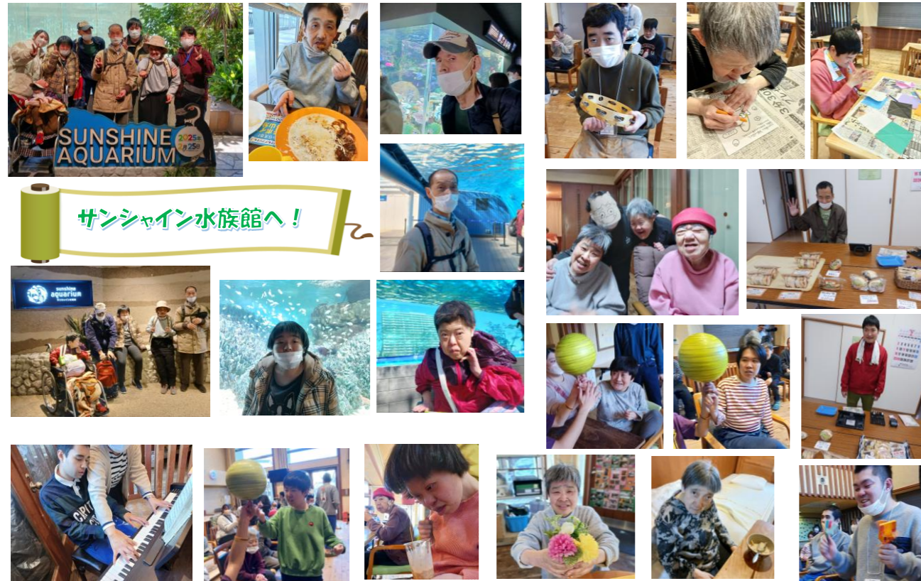
サンシャイン水族館へ!